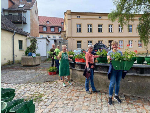
Aufampeln am 24. Mai

Jetzt schmücken schon mehr als 35 Blumenampeln das Stadtbild