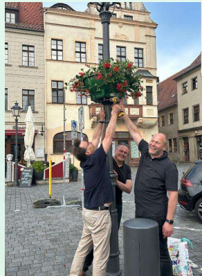
Nachampeln auf dem Markt am 05. Juni